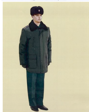
Рис. 20. Повседневная форма одежды для мужчин, куртка утепленная с шапкой из овчины