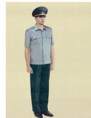
Рис. 15. Повседневная форма одежды для мужчин, сорочка повседневная с короткими рукавами без галстука