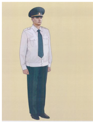
Рис. 12. Представительская форма одежды для мужчин, сорочка представительская с длинными рукавами