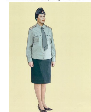
Рис. 26. Повседневная форма одежды для женщин, блуза повседневная с длинными рукавами