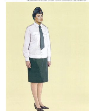
Рис. 25. Представительская форма одежды для женщин, блуза представительская с длинными рукавами