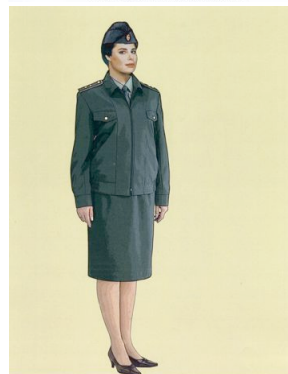
Рис. 24. Повседневная форма одежды для женщин, куртка повседневная шерстяная