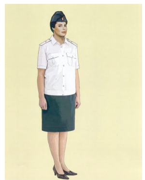
Рис. 27. Представительская форма одежды для женщин, блуза представительская с короткими рукавами без галстука