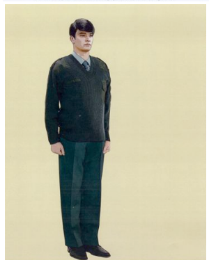
Рис. 16. Повседневная форма одежды для мужчин, джемпер полушерстяной