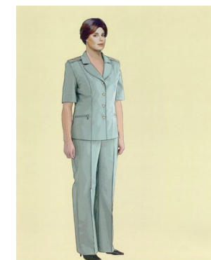
Рис. 32. Летняя повседневная форма одежды для женщин, костюм (пиджак и брюки) летний