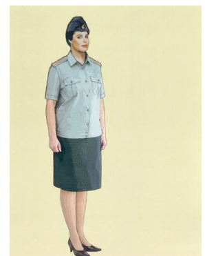
Рис. 29. Повседневная форма одежды для женщин, блуза повседневная с короткими рукавами без галстука