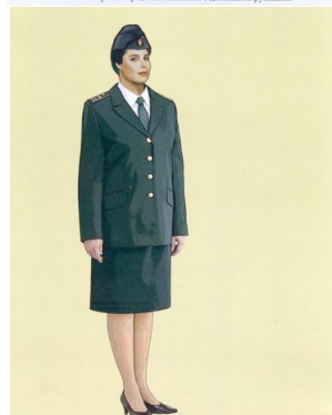
Рис. 23. Представительская форма одежды для женщин