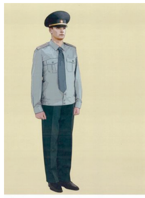
Рис. 13. Повседневная форма одежды для мужчин, сорочка повседневная с длинными рукавами