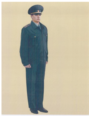
Рис. 11. Повседневная форма одежды для мужчин, куртка повседневная шерстяная