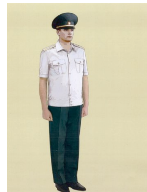
Рис. 14. Представительская форма одежды для мужчин, сорочка представительская с короткими рукавами без галстука