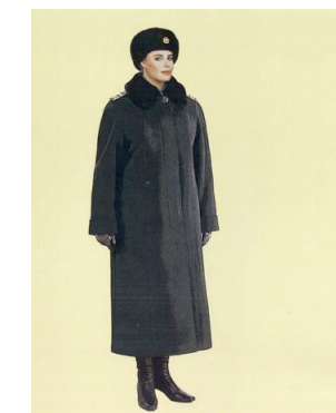
Рис. 36. Зимняя повседневная форма одежды для женщин, пальто зимнее и шапка из овчины