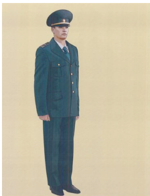
Рис. 10. Представительская форма одежды для мужчин